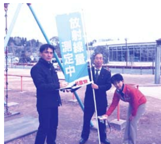
▲放射能測定をする 日本共産党水戸市議団 (千波公園好文カフェ前の広場)